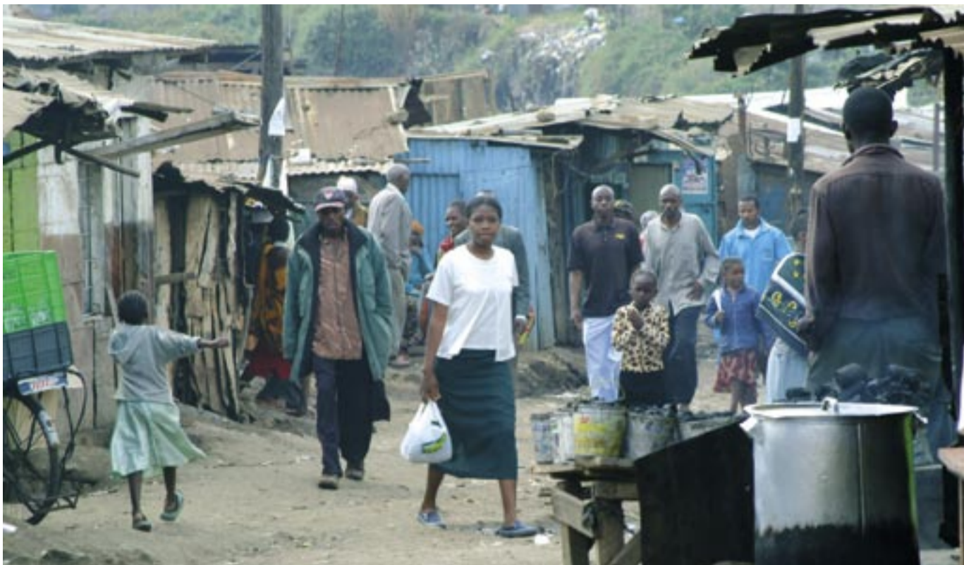
Strassenszene in Korogocho

Oktober 2007. Dreharbeiten für die TV-Dokumentation „Menschenrechtsstädte dieser Welt“ führen uns nach Korogocho, den drittgrößten Slum von Nairobi, der Hauptstadt Kenias. Koch, wie die Abkürzung für die „Ansammlung von Müll“ lautet, ist eine lebendige, dicht bevölkerte Stadt. Auf rund einem Quadratkilometer – ungefähr der Fläche des Grazer Bezirkes Innere Stadt, leben tausende Menschen. Da es keine Volkszählung gibt, gehen die Angaben weit auseinander, realistische Zahlen liegen bei rund 300.000 Personen. Eine schmale Straße durchschneidet den Slum, links und rechts sind armelige Hütten und Verkaufsstände, Menschenmassen ziehen dahin: Kinder auf dem Weg zur Schule, Männer und Frauen, die zur Arbeit gehen, Vertreter von Kirchen, Religionsgemeinschaften und Sekten in ihren bunten Kleidern.